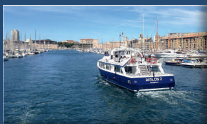
Aiglon III sortant du Vieux-Port Aiglon III coming out of the Vieux-Port