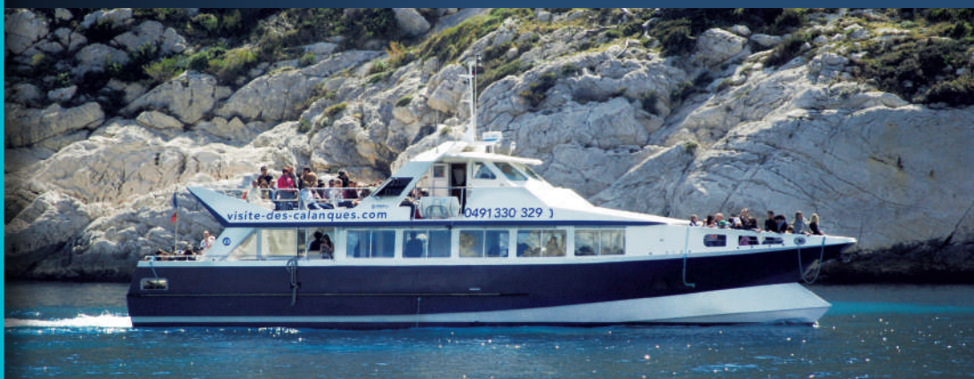
Aiglon III dans les Calanques Aiglon III into the Calanques

“Moment magique sur le pont panoramique.”