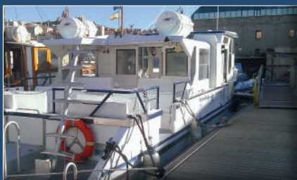
Thalassa 7, vue arrière Thalassa 7, rear view