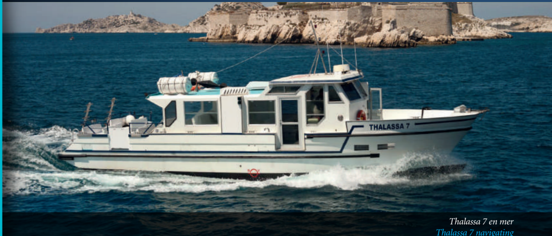
Thalassa 7 en mer Thalassa 7 navigating

“ Vedette rapide, spécialement conçue pour les activités aquatiques. ”