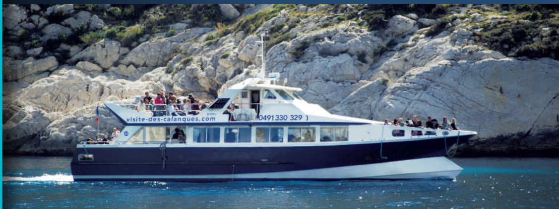
Aiglon III dans les Calanques Aiglon III into the Calanques

“Moment magique sur le pont panoramique.”