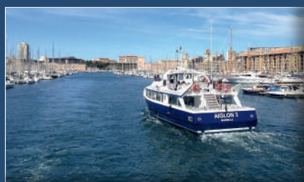
Aiglon 3 sortant du Vieux-Port Aiglon 3 coming out of the Vieux-Port