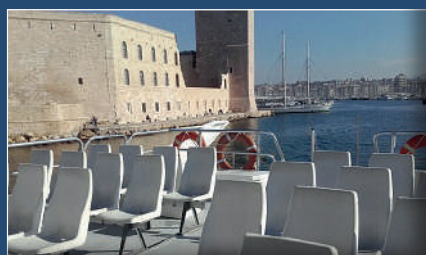
Pont panoramique Panoramic upper deck

This fast boat will make you discover all the beauties of the Calanques National Park and its surroundings.