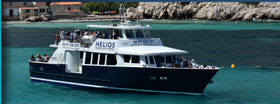
Helios en mer Helios navigating