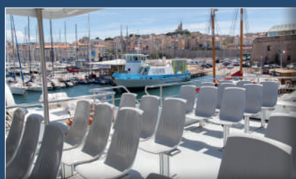
Pont supérieur Upper deck