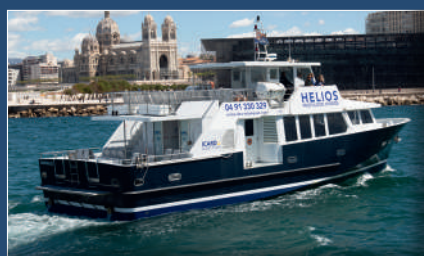
Helios devant le MuCEM Helios in front of MuCEM